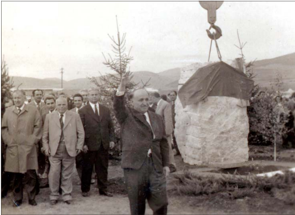
Началото на магистрала „Хемус“ е поставено през 1974 г. от Тодор Живков.