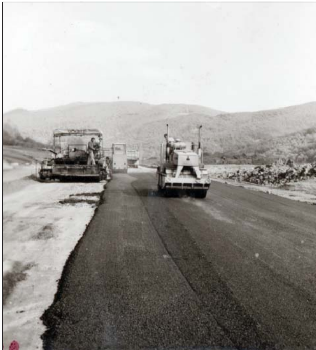
Слагане на асфалта на платната край Жерково.