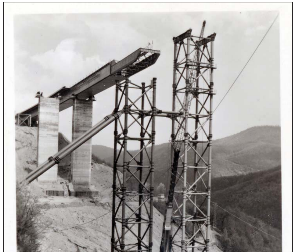
Строителството на виадукта при 27-ия километър, който е със стоманена конструкция.