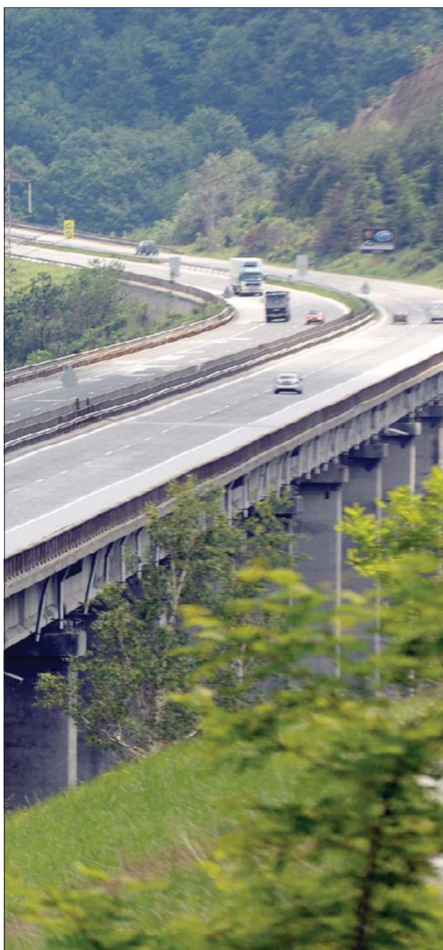
Магистралата може да бъде завършена през 2023 г.

За 5 г. ще са построени 250 км при 157 км за 45 г.