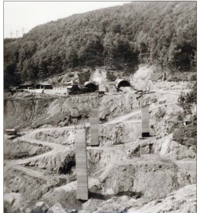
Етап от строителството на тунел „Витиня“ през 1979 г.

От пътен възел „Белокопитово“ до пътен възел „Буховци“ - отсечка с дължина 16,3 км, се работи от 16 август 2018 г., финалът се очаква да е през 2021 г. Там са инвестирани почти 120 млн. лв.