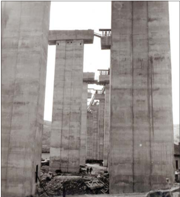
През 1978 г. магистралата стига до Витиня.