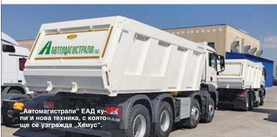
„Автомагистрали“ ЕАД купи и нова техника, с която ще се узгражда „Хемус“.