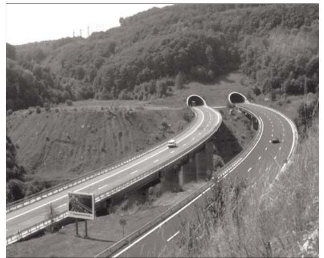
Виадуктът при 25-ия километър на магистралата, който е изграден в периода 1979-1985 г.