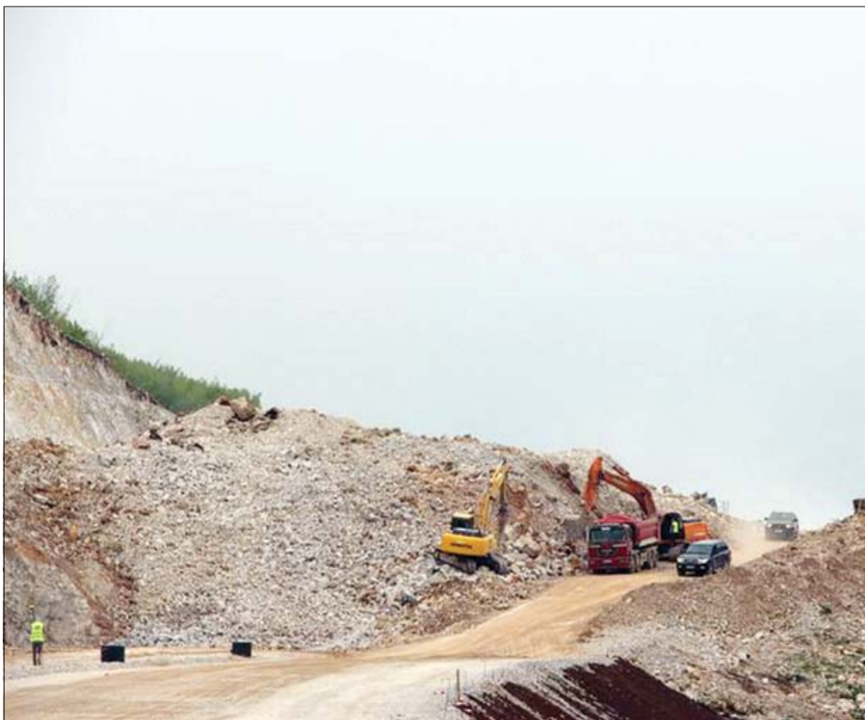
През есента ще са готови още близо 10 км от автомагистралата в отсечката от Аблианица до Боаза