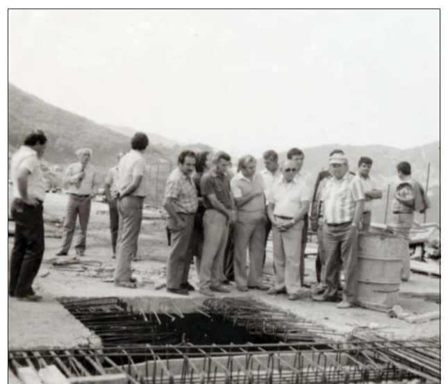
1985 г. - проверка на строителството на виадукт „Коренишки дол“